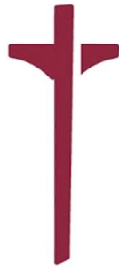
el árbol maestro | la cruz